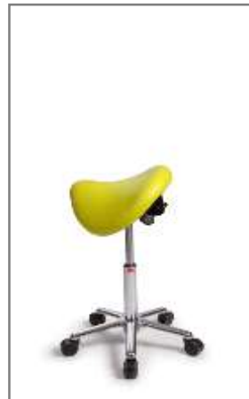
S- alleen met TENTE® wielen 450 – 600 mm (onbelast gemeten)