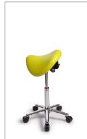
S+ 470 – 650 mm (onbelast gemeten)