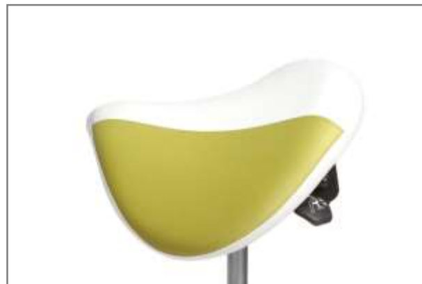
Gestoffeerd in 2 kleuren TWO TONE