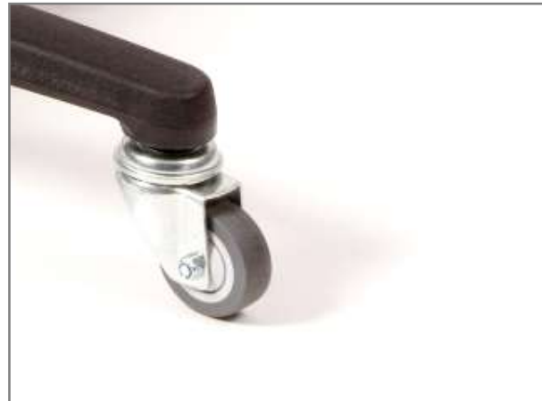
Industrie gelagerde wielen Ø 40mm met zacht loopvlak, vrij lopend. Geschikt voor harde en zachte ondergrond