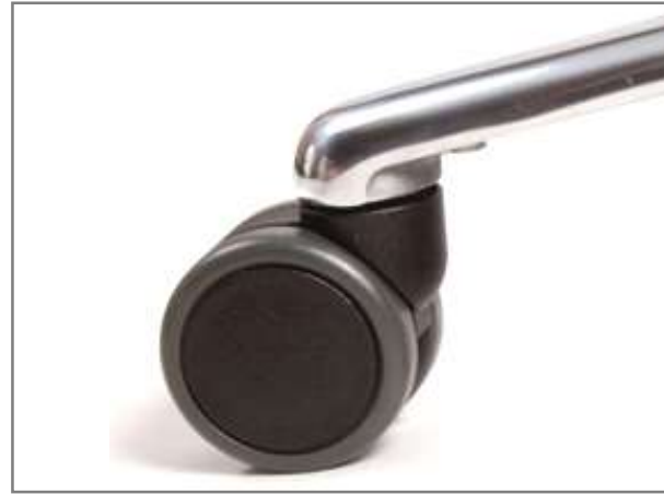
Wielen Ø 65mm met zacht loopvlak Geschikt voor harde en zachte ondergrond Maakt geen geluid door de geruisloze pin