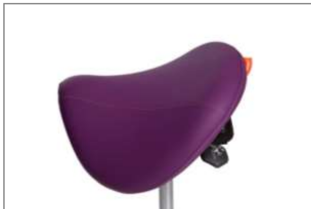
Gestoffeerd in 1 kleur

Silvertex™ detail Behandeld met: PERMABLOK3 & SILVERGUARD Voor specificaties download de stoffenkaart