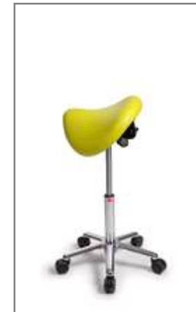
M 560 – 740 mm (onbelast gemeten)