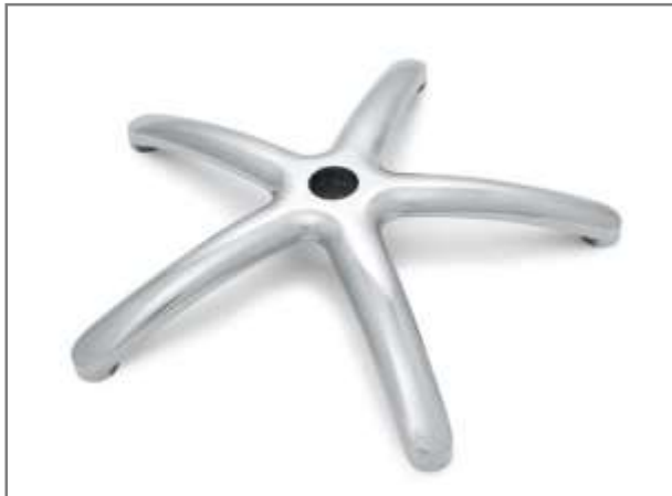
Gepolijst aluminium kruisvoet Ø 600mm (ANSI-BIFMA getest)