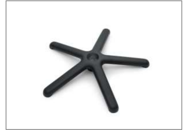
Zwart poedercoat aluminium kruisvoet Ø 500mm (ANSI-BIFMA getest)