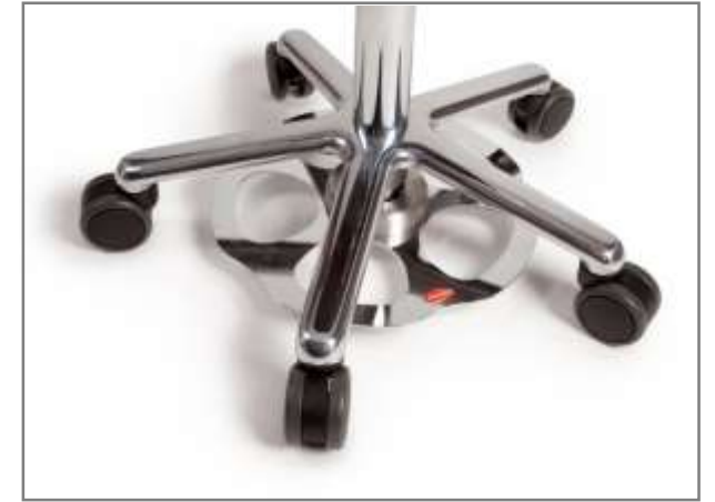
Voetbediening, verchroomde gasveer (maat M) gasveer met de voet als wel met de hand te bedienen