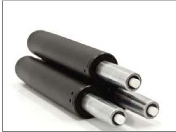
Gasveer klasse III zwart of verchroomd, het hart van de kruk verkrijgbaar in verschillende maten, OEM mogelijkheden, vraag naar de voorwaarden