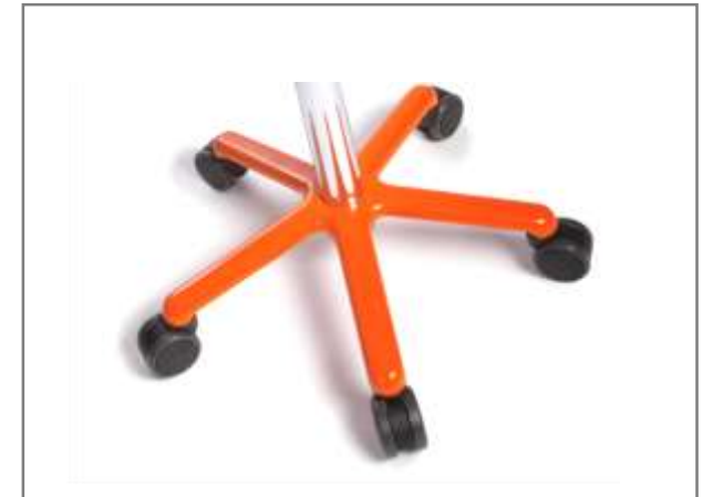
(OEM) in elke RAL kleur te verkrijgbaar, vraag naar de voorwaarden