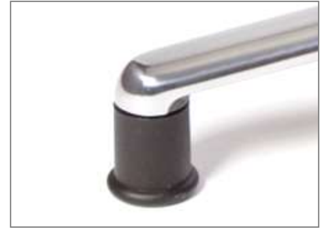
Glijders Ø 38mm en 550mm hoog Geschikt voor harde en zachte ondergrond