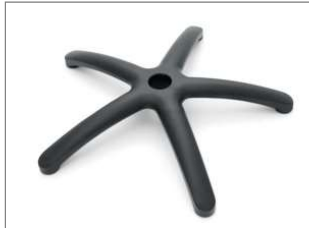
Zwart poedercoat aluminium kruisvoet Ø 600mm (ANSI-BIFMA getest)