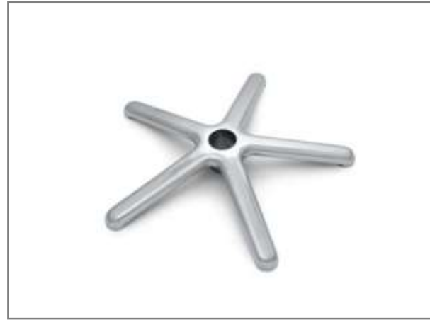
Gepolijst aluminium kruisvoet Ø 500mm (ANSI-BIFMA getest)