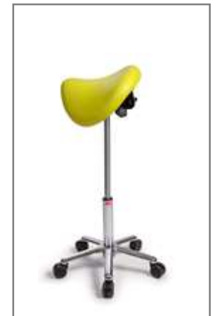
L 630 – 870 mm (onbelast gemeten)