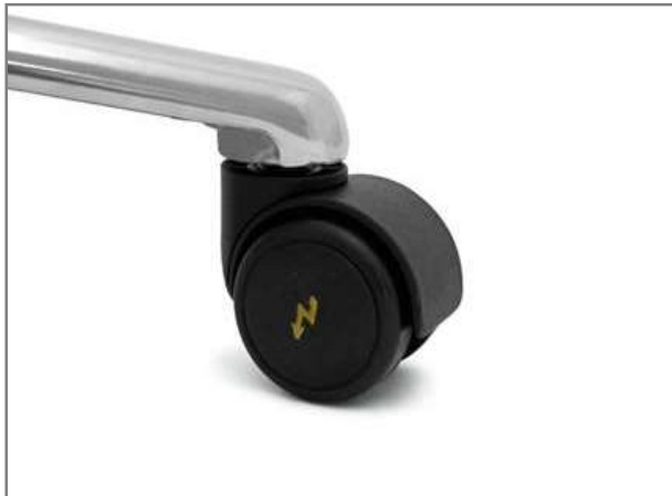
ESD wielen in verschillende maten en uitvoeringen. Geschikt voor harde en zachte ondergrond