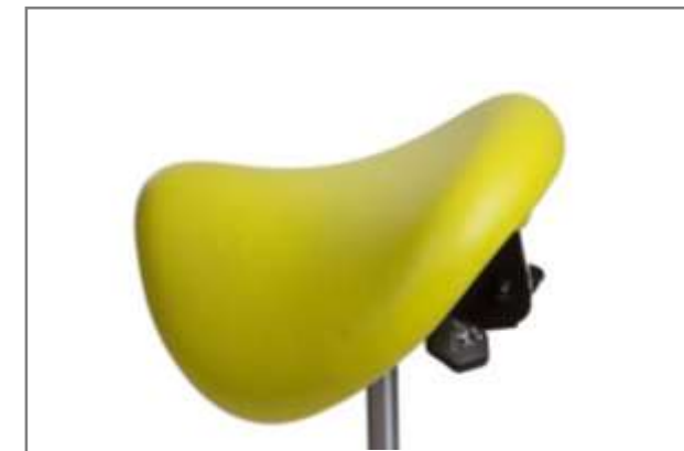
FOAM JACKET, 100% naadloos, zowel de boven als onderzijde. Ook naadloze stoffering mogelijk met Valencia™ of Silvertex™