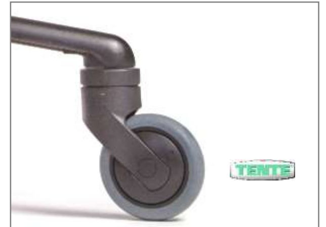
TENTE® industrie gelagerde wielen Ø 75mm met zacht loopvlak, geschikt voor harde ondergrond, vrijlopend Geschikt voor o.a. de gezondheidszorg; gemakkelijk schoon te maken. Maakt de stoel 30 mm hoger dan de aangegeven maten van de gasveren.