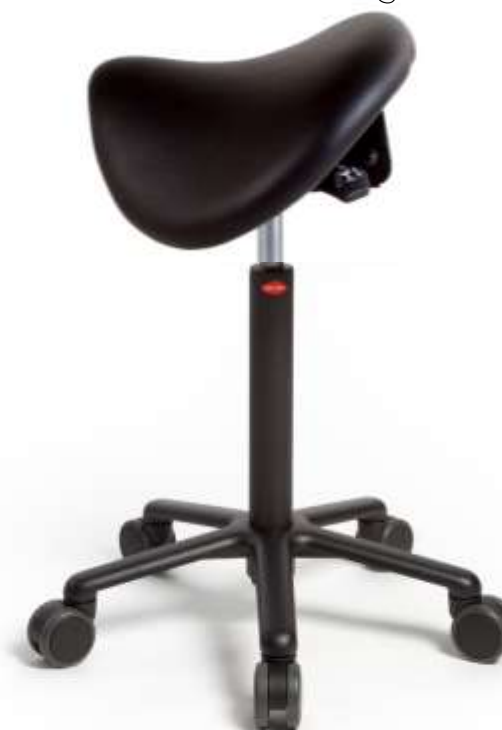
Black Edition Aluminium onderstel zwart gecoat